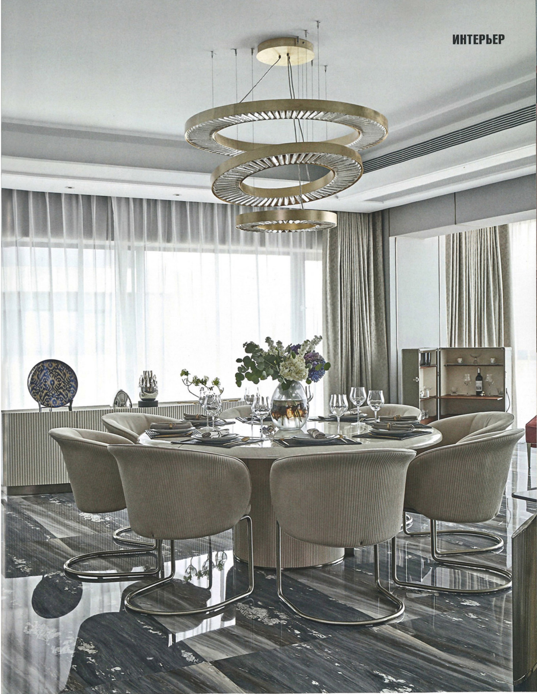
Справа Общий вид столовой. Обеденный стол—бестселлер Visionnaire, модель Opera

Дизайнеры компании VISIONNAIRE, занимавшейся оформлением интерьера апартаментов, учли и обыграли архитектурные особенности постройки Имбриги. В интерьере много светоотражающих, глянцевых поверхностей, усиливающих эффект светового шоу. Продуманы разные световые сценарии, подобраны самые разные модели—от люстр до точечного света и бра (скульптурное, сложное освещение—из каталогов фабрики), которые можно включать как ансамблем, так и камерно, сольно. Но в целом неяркая гамма не даёт интерьеру превратиться в лазерное