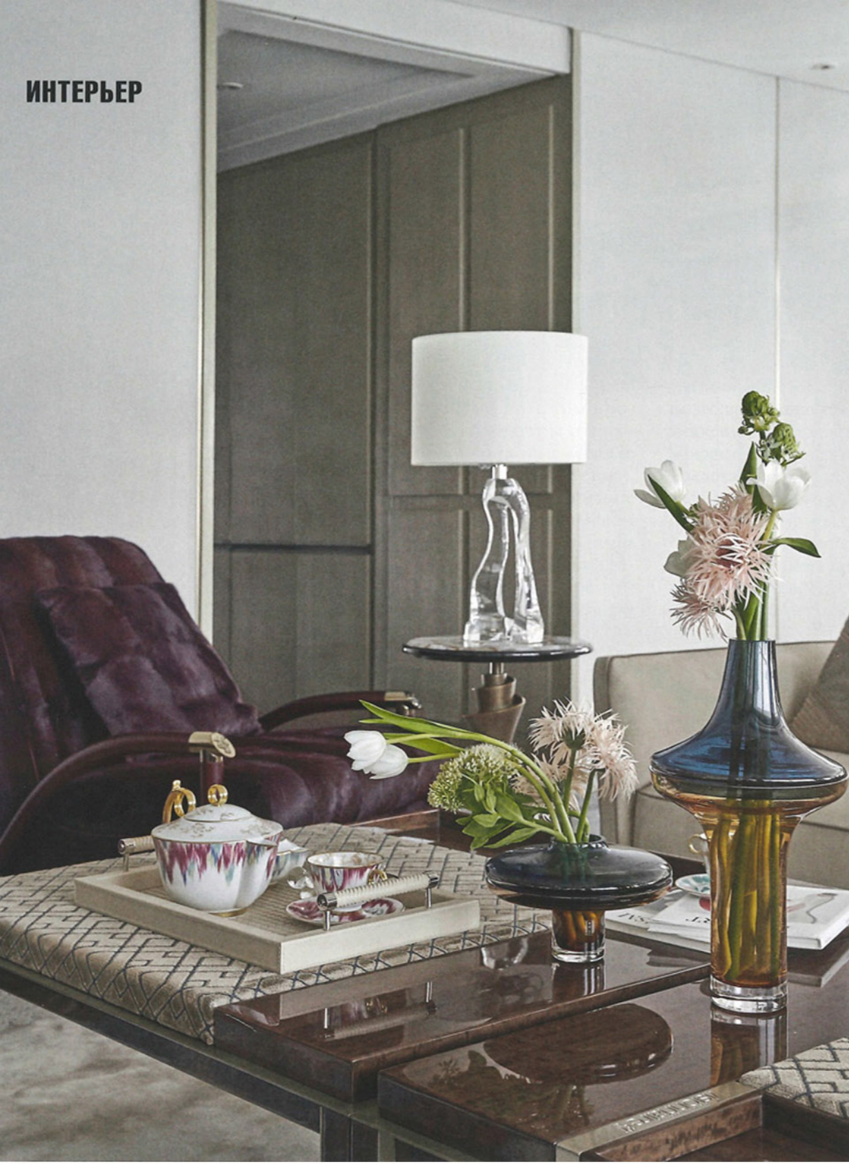
Фрагмент гостиной. Кресло и журнальные столики со столеш- ницами из спилов агата—от Visionnaire