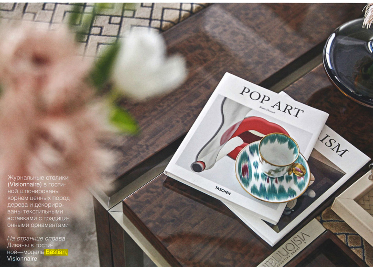
Журнальные столики (Visionnaire) в гостиной шпонированы корнем ценных пород дерева и декорированы текстильными вставками с традиционными орнаментами

В интерьере много глянцевых поверхностей, усиливающих эффект светового шоу